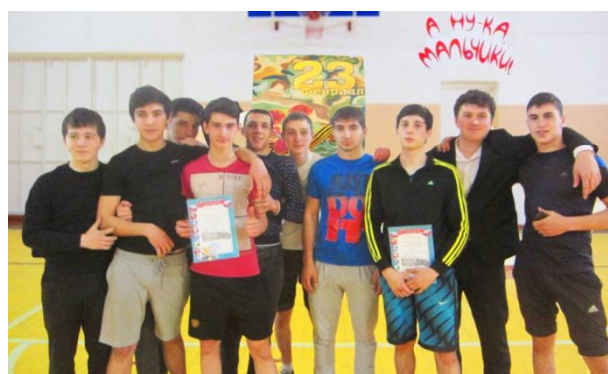
Соревнуются сборные команды 9 и 10 классов. Победила дружба!

Прошедший месячник способствовал формированию патриотизма и активной гражданской позиции учащихся, сплочению детских коллективов, помог выявить лидерские качества воспитанников. Ведь задача школы - не только дать детям знания, но и воспитать в них глубокое убеждение, что они, являясь гражданами своей страны, должны уметь защищать Отечество.