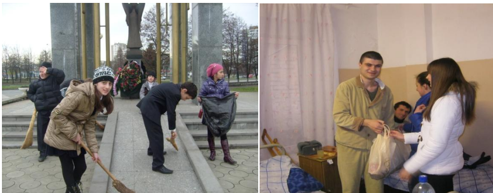
Волонтёры 9 – 10 классов

Волонтёры школы провели школьную акцию «Посылка солдату», «Открытие ветерану», организовали и провели уборку памятников и приняли активное участие в городской акции «Здравствуй, солдат».